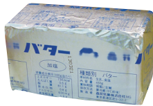
1ポンド売りのバター

アメリカやイギリスで使われていたよ。今は g や kg を使うことが国際的に決まっているけれどポンドを使う人も多いんだ。人が1日に食べる大麦の量をもとにした単位なんだって。1ポンドは約 450g だよ。