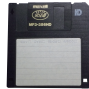
フロッピーディスク

以前はパソコンのデータの記ろくにフロッピーディスクというものが使われていたけど、今のCD-ROMはその約500まい分ものデータが入るんだ。 ※フロッピーディスクにほぞんできるデータの大きさ(容量)は 1.44MB だったのに対し、CD-ROMには約 700MB のデータがほぞんできます。